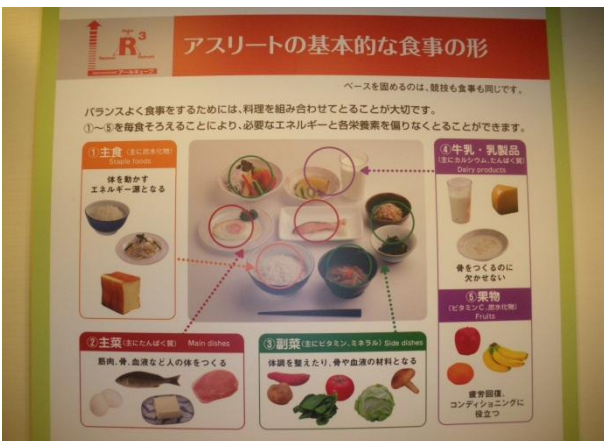
↑ 豊富なメニュー全てにカロリー表示あり