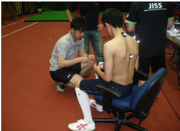
↑上半身に測定マーカー