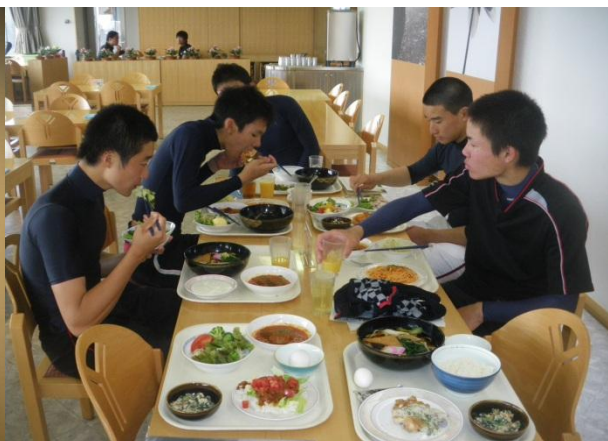
↑ 3500カロリー摂取目指しメニュー選び