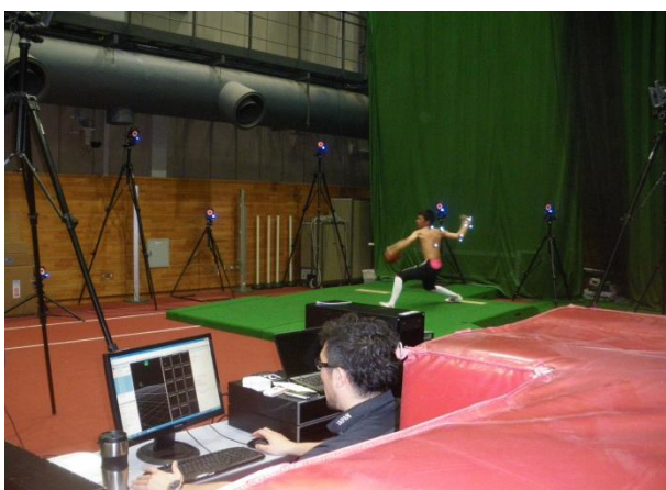
↑高性能カメラ14台に囲まれて