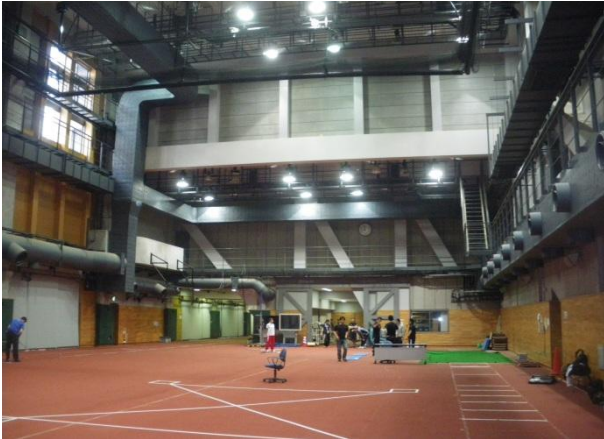
↑ 広大な J I S S 体育館

① 朝9時から入館し、午前中は基礎体力測定。柔軟性のチェックや垂直跳び、シャトルランなど。