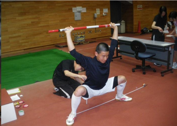
↑ 柔軟性のチェック